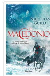
EL MACEDONIO GUILD, NICHOLAS