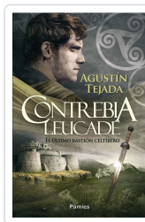
CONTREBIA LEUCADE TEJADA NAVAS, AGUSTÍN