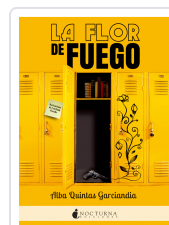
LA FLOR DE FUEGO QUINTAS GARCÍANDIA, ALBA