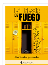
LA FLOR DE FUEGO QUINTAS GARIANDÍA, ALBA