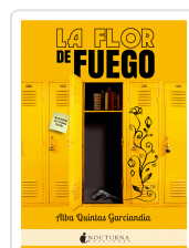
LA FLOR DE FUEGO QUINTAS GARIANDÍA, ALBA