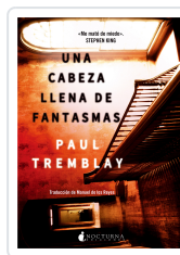
UNA CABEZA LLENA DE FANTASMAS TREMBLAY, PAUL