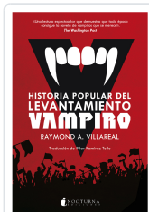
HISTORIA POPULAR DEL LEVANTAMIENTO VAMPIRO VILLAREAL, RAYMOND A.