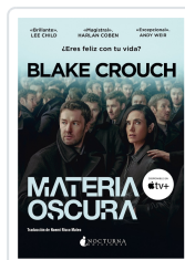
MATERIA OSCURA CROUCH, BLAKE