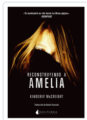
RECONSTRUYENDO A AMELIA MCCREIGHT, KIMBERLY