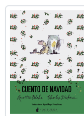
CUENTO DE NAVIDAD DICKENS, CHARLES