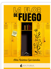
LA FLOR DE FUEGO QUINTAS GARCÍANDIA, ALBA