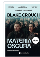
MATERIA OSCURA CROUCH, BLAKE