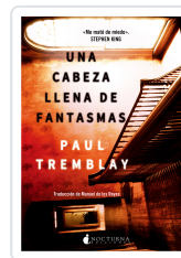
UNA CABEZA LLENA DE FANTASMAS TREMBLAY, PAUL