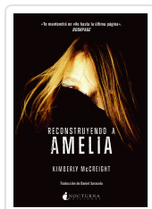
RECONSTRUYENDO A AMELIA MCCREIGHT, KIMBERLY