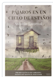
PÁJAROS EN UN CIELO DE ESTAÑO ANTONIO TOCORNAL