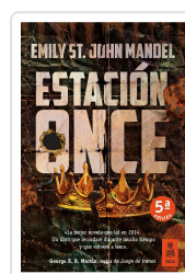
ESTACIÓN ONCE (7ª ED.) MANDEL, EMILY ST. JOHN