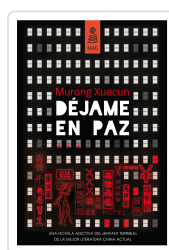
DÉJAME EN PAZ XUECUN, MURONG