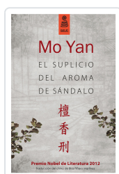
EL SUPLICIO DEL AROMA DE SÁNDALO (3ª ED.) YAN, MO