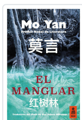
EL MANGLAR YAN, MO