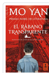
EL RÁBANO TRANSPARENTE YAN, MO