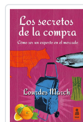
LOS SECRETOS DE LA COMPRA MARCH FERRER, LOURDES