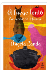
A FUEGO LENTO LANDA APARICIO, ÁNGELA