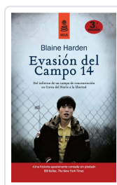
EVASIÓN DEL CAMPO 14 (5ª ED.) HARDEN, BLAINE