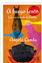
A FUEGO LENTO LANDA APARICIO, ÁNGELA