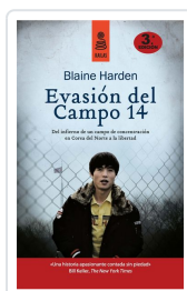
EVASIÓN DEL CAMPO 14 (5ª ED.) HARDEN, BLAINE