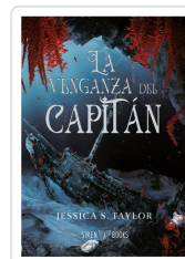
LA VENGANZA DEL CAPITÁN S. TAYLOR, JESSICA