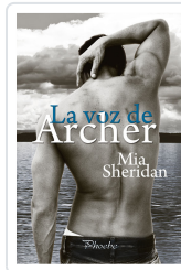
LA VOZ DE ARCHER PHOEBE - SHERIDAN, MIS