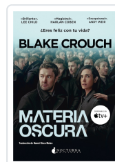
MATERIA OSCURA CROUCH, BLAKE