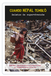
CUANDO NEPAL TEMBLÓ VARIOS AUTORES