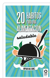
20 HÁBITOS PARA UNA ALIMENTACIÓN SALUDABLE RUÍZ GÓMEZ, AMPARO