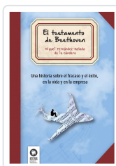
EL TESTAMENTO DE BEETHOVEN FERNÁNDEZ-RAÑADA DE LA GÁNDARA, MIGUEL