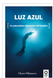
LUZ AZUL VILLANUEVA TOMAS, ULYSES