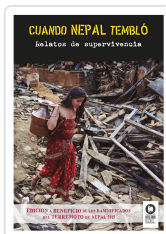
CUANDO NEPAL TEMBLÓ VARIOS AUTORES