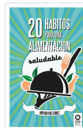
20 HÁBITOS PARA UNA ALIMENTACIÓN SALUDABLE RUÍZ GÓMEZ, AMPARO