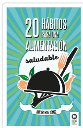
20 HÁBITOS PARA UNA ALIMENTACIÓN SALUDABLE RUÍZ GÓMEZ, AMPARO