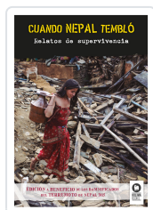
CUANDO NEPAL TEMBLÓ VARIOS AUTORES