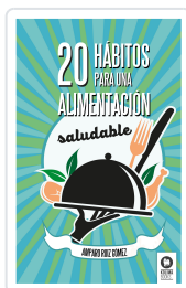
20 HÁBITOS PARA UNA ALIMENTACIÓN SALUDABLE RUÍZ GÓMEZ, AMPARO