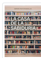
LA CASA DE LA SABIDURÍA PASTOR BADELLES, AMPARO