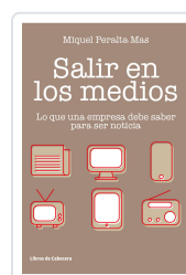
SALIR EN LOS MEDIOS PERALTA MAS, MIQUEL