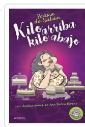
PERRA DE SATÁN, KILO ARRIBA, KILO ABAJO PERRADESATÁN