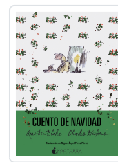
CUENTO DE NAVIDAD DICKENS, CHARLES