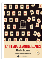
LA TIENDA DE ANTIGÜEDADES DICKENS, CHARLES