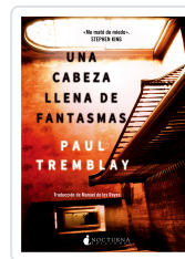
UNA CABEZA LLENA DE FANTASMAS TREMBLAY, PAUL