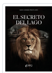
EL SECRETO DEL LAGO PRIETO AÑO, MARI CARMEN