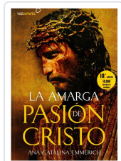
LA AMARGA PASION DE CRISTO (14ª ED.) ANA CATALINA EMMERICH