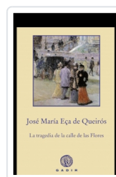
LA TRAGEDIA DE LA CALLE DE LAS FLORES EÇA DE QUEIRÓS, JOSÉ MARÍA