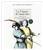
LA VÍSPERA DE SANTA INÉS KEATS, JOHN