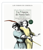
LA VÍSPERA DE SANTA INÉS KEATS, JOHN