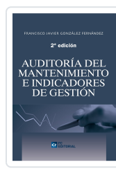
AUDITORÍA DEL MANTENIMIENTO E INDICADORES DE GESTIÓN. 2ª ED. FRANCISCO JAVIER GONZÁLEZ FERNÁNDEZ