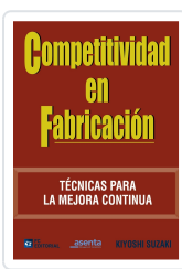
COMPETITIVIDAD EN FABRICACIÓN KIYOSHI SUZAKI