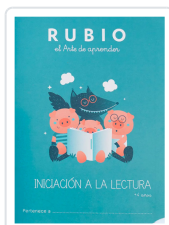
INICIACIÓN A LA LECTURA RUBIO +4 VARIOS AUTORES