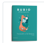
INICIACIÓN A LA LECTURA RUBIO +5 VARIOS AUTORES