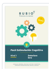
PACK ESTIMULACIÓN COGNITIVA. NIVEL 1 (DETERIORO LEVE) PEDROSA CASADO, BEATRIZ