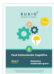
PACK ESTIMULACIÓN COGNITIVA. NIVEL 3 (DETERIORO MODERADO-GRAVE) PEDROSA CASADO, BEATRIZ