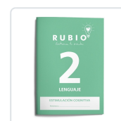
ESTIMULACIÓN COGNITIVA: LENGUAJE 2 PEDROSA CASADO, BEATRIZ