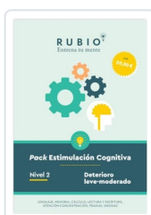
PACK ESTIMULACIÓN COGNITIVA. NIVEL 2 (DETERIORO LEVE-MODERADO) PEDROSA CASADO, BEATRIZ