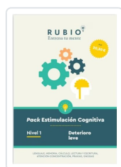
PACK ESTIMULACIÓN COGNITIVA. NIVEL 1 (DETERIORO LEVE) PEDROSA CASADO, BEATRIZ