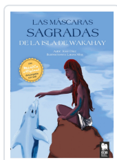
LAS MÁSCARAS SAGRADAS DE LA ISLA DE WAKAHAY DÍAZ SERRANO, JOSE