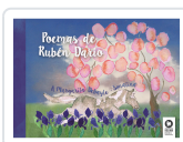
POEMAS DE RUBÉN DARÍO DARÍO, RUBÉN