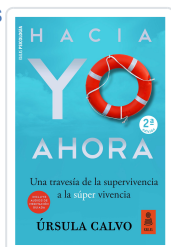
HACIA YO AHORA (2ª ED.) CALVO CASAS, ÚRSULA