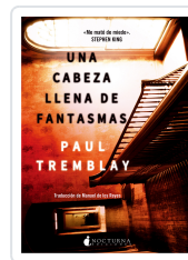
UNA CABEZA LLENA DE FANTASMAS TREMBLAY, PAUL