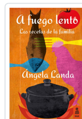
A FUEGO LENTO LANDA APARICIO, ÁNGELA