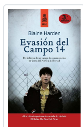
EVASIÓN DEL CAMPO 14 (5ª ED.) HARDEN, BLAINE