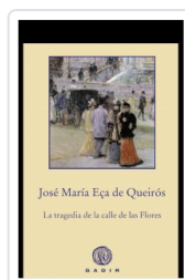
LA TRAGEDIA DE LA CALLE DE LAS FLORES EÇA DE QUEIRÓS, JOSÉ MARÍA