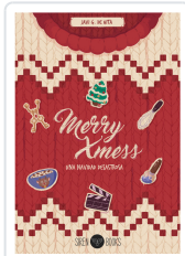
MERRY XMESS: UNA NAVIDAD DESASTROSA G. DE HITA, JAVI