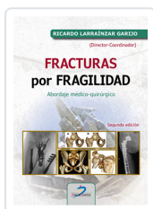
FRACTURAS POR FRAGILIDAD LARRAÍNZA GARJO, RICARDO