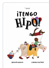
¡TENGO HIPO! BUENO, BEGOÑA