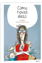
CÓMO TENER IDEAS RHEI, SOFÍA