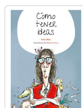
CÓMO TENER IDEAS RHEI, SOFÍA