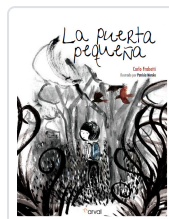
LA PUERTA PEQUEÑA FRABETTI, CARLO