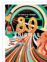
LA VUELTA AL MUNDO EN 80 ENIGMAS FRABETTI, CARLO