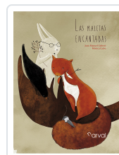
LAS MALETAS ENCANTADAS GISBERT, JOAN MANUEL