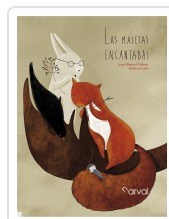
LAS MALETAS ENCANTADAS GISBERT, JOAN MANUEL