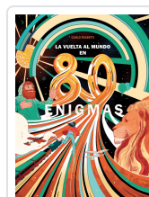
LA VUELTA AL MUNDO EN 80 ENIGMAS FRABETTI, CARLO