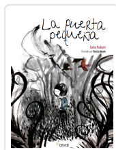
LA PUERTA PEQUEÑA FRABETTI, CARLO